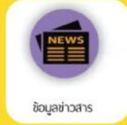
ข้อมูลข่าวสาร

การแจ้งขอความช่วยเหลือ กรณีเกิดอุบัติเหตุ ผ่านทางโทรศัพท์ หรือส่ง SMS ระบุพิกัดที่อยู่ ปัจจุบันให้แก่ผู้รับปลายทาง