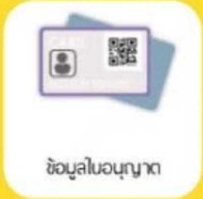
ข้อมูลใบอนุญาต

ใบอนุญาตขับรถเสมือนจริง ทั้งด้านหน้าและด้านหลัง