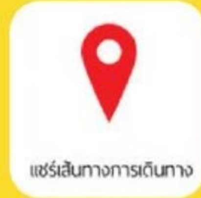
แชร์เส้นทางการเดินทาง

การแสดงผลข้อมูลส่วนบุคคล เช่น กรุ๊ปเลือด ประวัติการ แพ้ยา โรคประจำตัวสิทธิ การเข้ารับการรักษาพยาบาล ชื่อผู้ติดต่อกรณีเกิดเหตุ ฉุกเฉิน และการบริจาคอวัยวะ ให้แก่สภากาชาดไทย