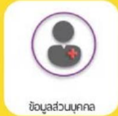
ข้อมูลส่วนบุคคล

ใบอนุญาตขับรถเสมือนจริง ทั้งด้านหน้าและด้านหลัง