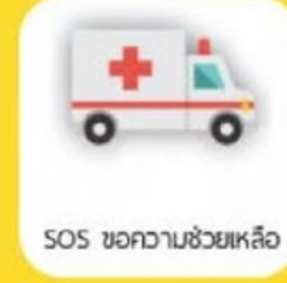
SOS ขอความช่วยเหลือ

การแชร์เส้นทางการเดินทาง แจ้งพิกัดพร้อมหมายเลข ทะเบียนรถสาธารณะ (TAXI) หรือรถโดยสารสาธารณะ ให้แก่บุคคลที่ต้องการทราบ หรือติดตามตัวได้